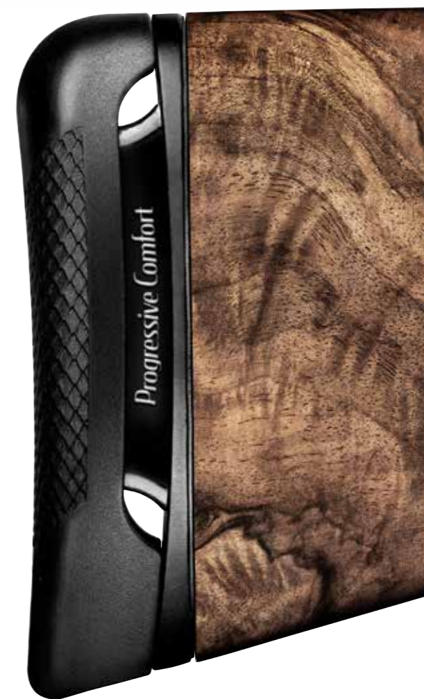
Progressive Comfort è il nuovissimo sistema che riduce in modo progressivo la sensazione di rinculo e che si attiva in modo graduale anche con le cariche più leggere. Il meccanismo inserito nel calcio e collegato al calciolo riduce al minimo le vibrazioni e l'impennamento dell'arma