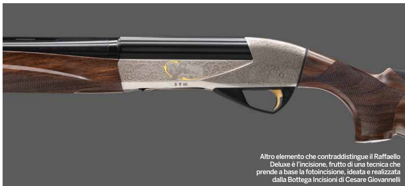
Altro elemento che contraddistingue il Raffaello Deluxe è l'incisione, frutto di una tecnica che prende a base la fotoincisione, ideata e realizzata dalla Bottega Incisioni di Cesare Giovannelli

LA SCELTA DEI LEGNI È IMPORTANTE SUL PIANO FUNZIONALE ED ESSENZIALE, ECCO PERCHÉ PRIMA DI ESSERE LAVORATI I LEGNI DEI BENELLI VENGONO STAGIONATI IN ARIA